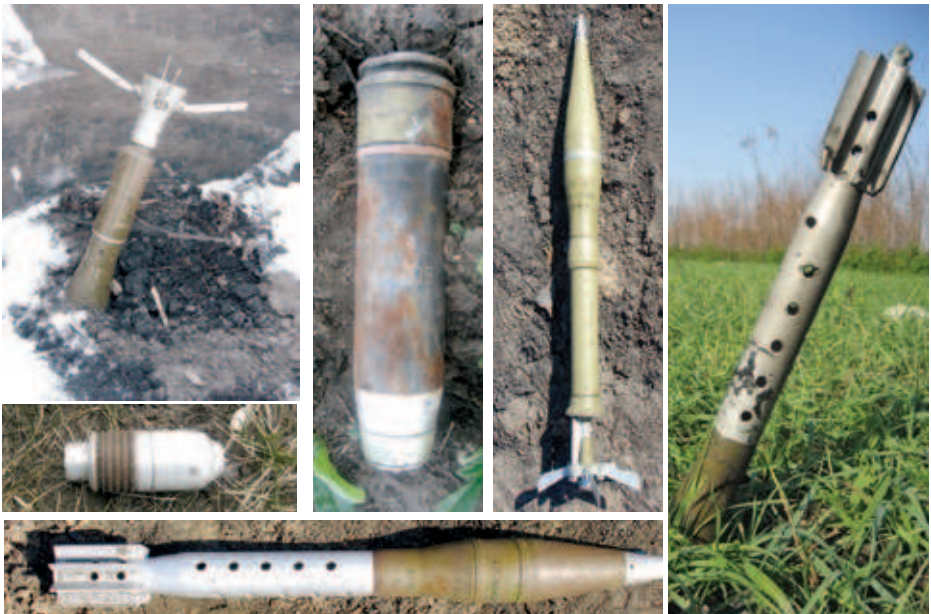
Постріли із гранатометів