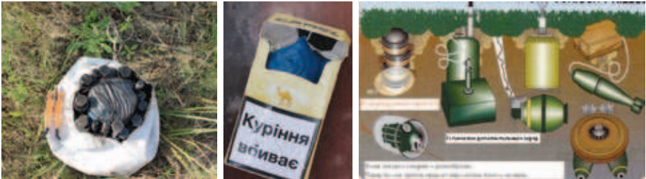
Замаскована міна-пастка у м'ячі, пачки з-під цигарок та основні види мінування. Зона можливого ураження в радіусі 150 м

МІНА-ПАСТКА - спеціальний пристрій, який може бути замаскований під безпечні на вигляд предмети побуту. Пристосований для того, щоб убивати чи завдавати ушкоджень. Спрацьовує раптово, коли людина торкається чи наближається до, начебто, нешкідливого предмета або здійснює, здавалося б, безпечну дію. Найчастіше встановлюються в будинках, спорудах, поблизу предметів повсякденного вжитку, зброї, дитячих іграшок.