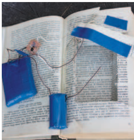
Спеціально встановлений вибухонебезпечний підірвний засіб, (міна-пастка) замаскований в банки з-під кави та книжку